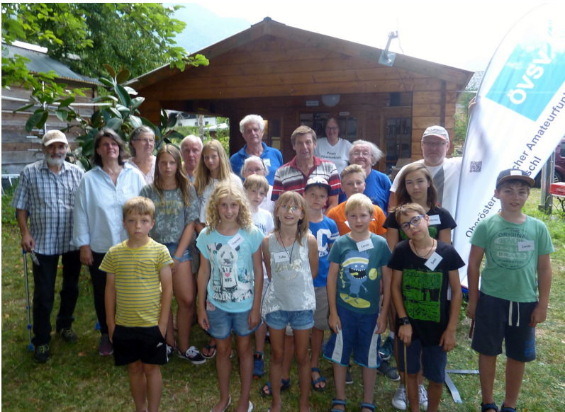
Bild groß (/export/shared/.content/.galleries/Bilder-News-und-Veranstaltungen/Ferienhit-2018-3.JPG)

Auch heuer erhielten alle teilnehmenden Jugendlichen eine farbige Teilnahme-Urkunde mit ihrem Vornamen zur bleibenden Erinnerung an diesen abwechslungsreichen Dienstag-Nachmittag.